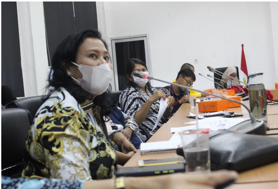
Peserta Kegiatan Penguatan dan Pengembangan SDM Inkubator Bisnis dan Teknologi